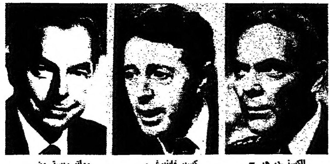
ولتر ريسون، كاسبر فاينبرغر، الكسندر هيج

AL-ANBA DAILY - JERUSALEM THU. 4 DEC. 1980 VOL. XIII NO. 3696